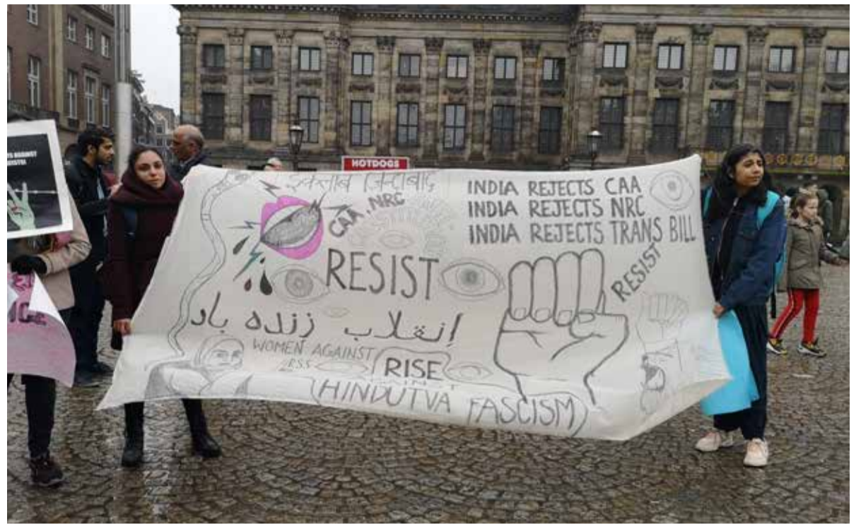
■ Solidariteitsprotest van de Indiase diaspora in Amsterdam, 8 februari

Als antwoord op de jarenlange aanval gingen de vakbonden begin dit jaar weer de straat op in een algemenestaking. Ze eisten in een twaalfpuntenprogramma onder andere een verhoging van het mini-