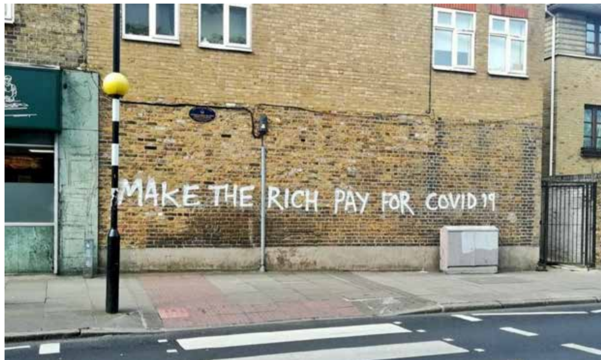
Graffiti in Londen

Daar komt nog bij dat het winstgevend is om een vaccin niet algemeen beschikbaar te stellen. Zo wordt in Nederland weinig getest op coronavirus, omdat ziekenhuizen voor deze tests afhankelijk zijn van multinational Roche. De door dit bedrijf geleverde apparatuur werkt alleen met onderdelen en vloeistoffen van datzelfde bedrijf. Roche levert nog maar 30 procent van de