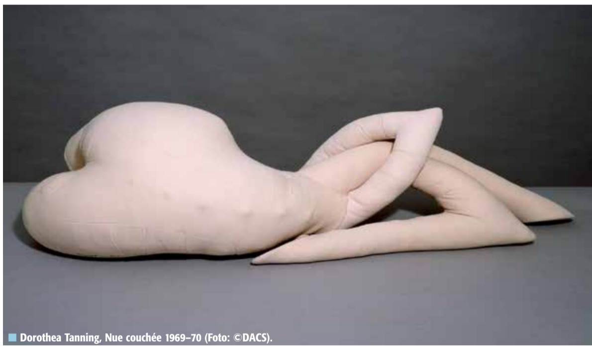
■ Dorothea Tanning, Nue couchée 1969-70 (Foto: © DACS).

In de 21ste eeuw is een toekomst zonder honger, onderdrukking en oorlog mogelijk. Om dat te bereiken is een beweging nodig die sterk genoeg is om het kapitalisme te breken. We nodigen iedereen uit om hieraan mee te bouwen.