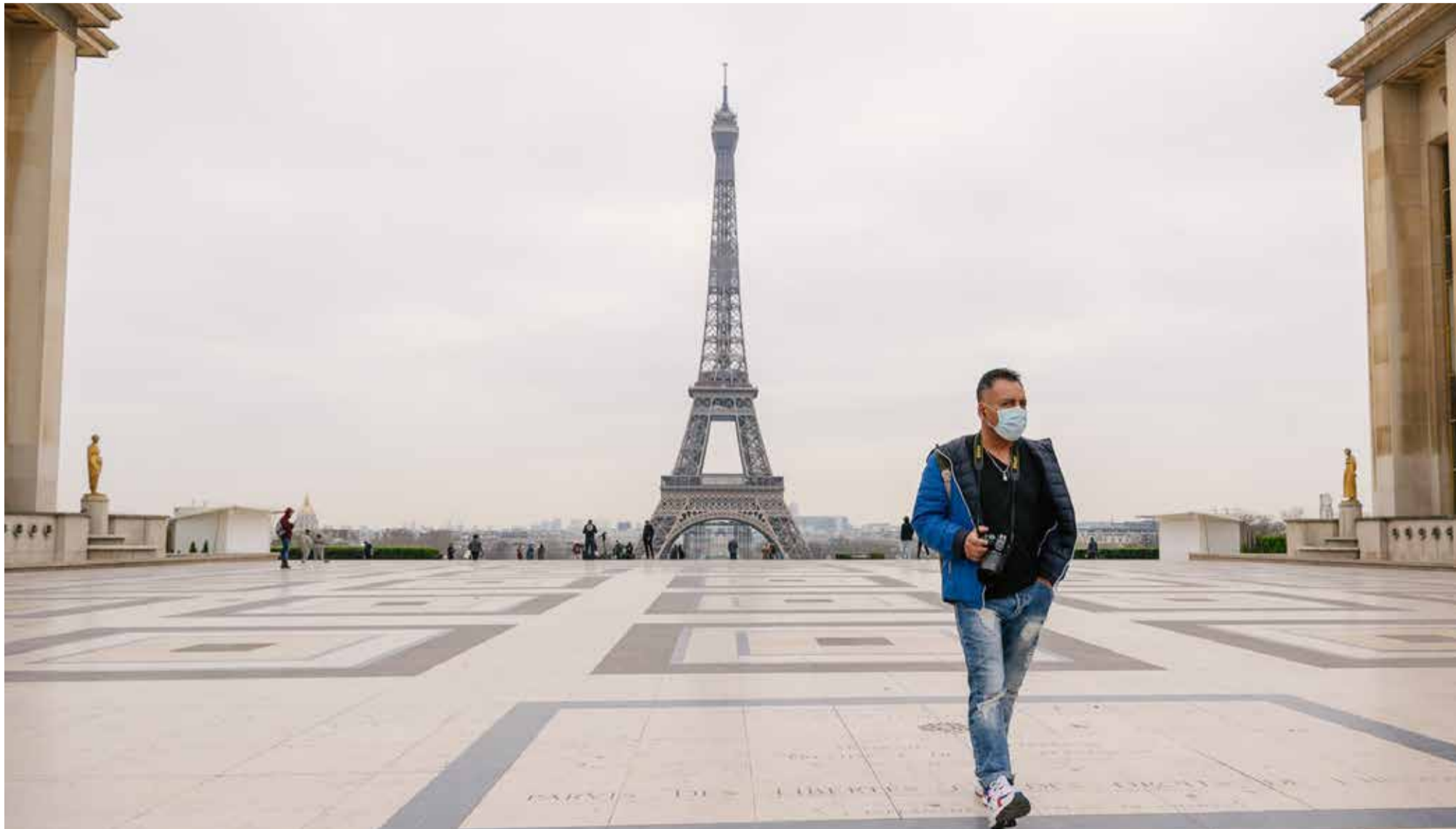
■ Parijs tijdens de eerste dag van de lockdown.

hand boven het hoofd gehouden tijdens de uitbraken van H1N1 (in 2009) en H5N2.