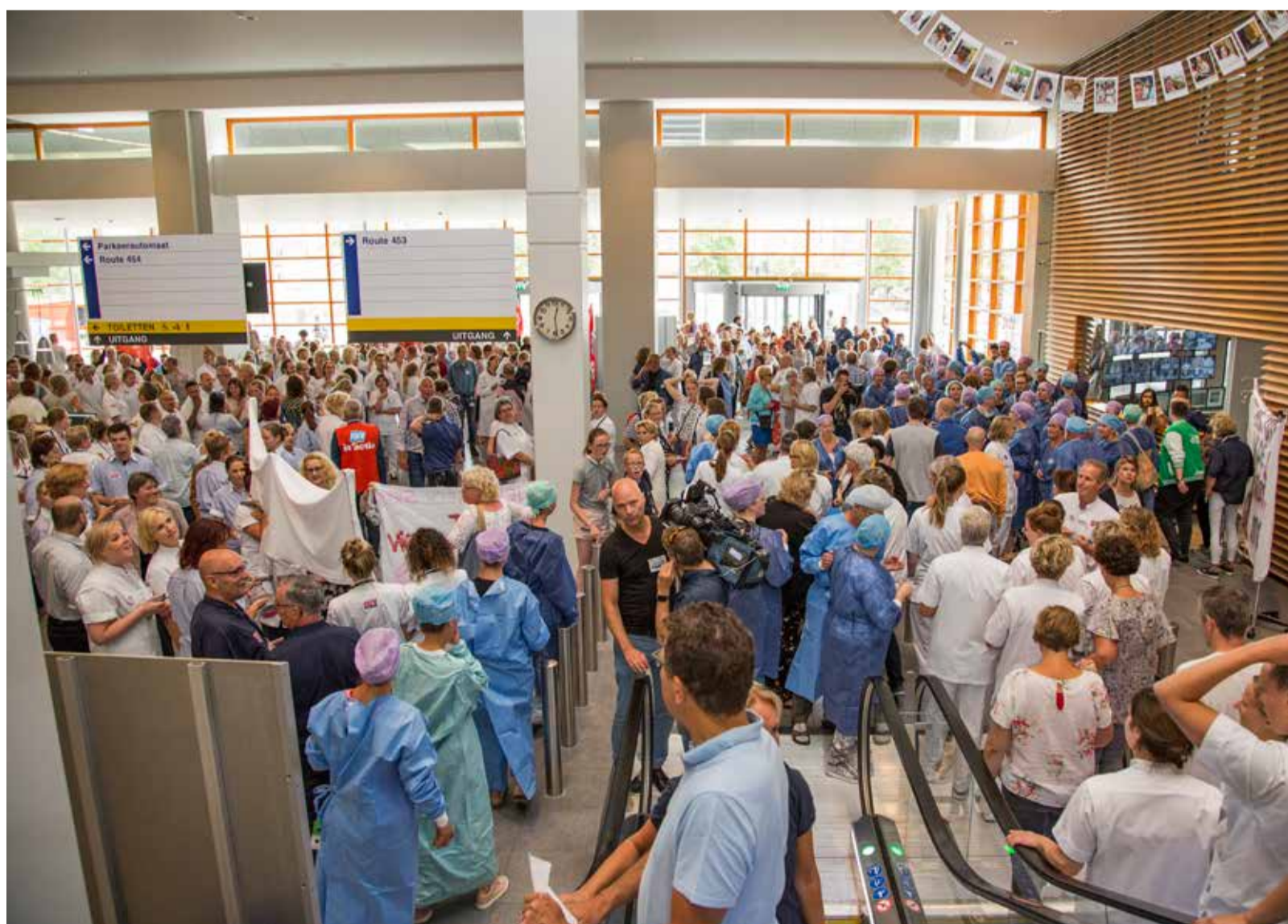
■ Personeel van het Leids Universitair Medisch Centrum in actie, 9 juli 2018.

Links moet zichzelf ook anders gaan organiseren. Binnen blijven biedt mogelijkheden om meer te lezen en jezelf politiek te scholen, maar ook hier schuilt het gevaar van isolatie. Daarom moet links alternatieven ontwikkelen en met politieke ideeën en eisen komen die zijn ontwikkeld op bijeenkomsten die digitaal opgezet worden. De politieke koers die de komende weken en maanden wordt uitgezet, zal een beslissende invloed hebben op toekomstige ontwikkelingen. We hebben een wereld te winnen waarbij onze levens voor hun winst gaan.