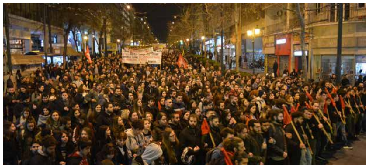
■ Demonstratie in solidariteit met vluchtelingen in Athene, 5 maart 2020

Katerina Papadouli is een revolutionair socialist in Athene. Dit artikel werd begin maart geschreven.