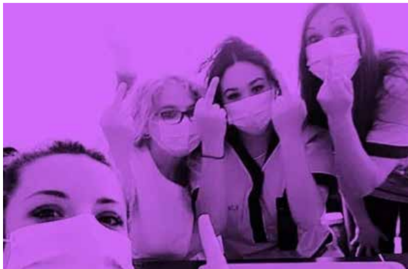
Een boodschap van Franse zorgwerkers voor Macron-stemmers die voor hen applaudiseren